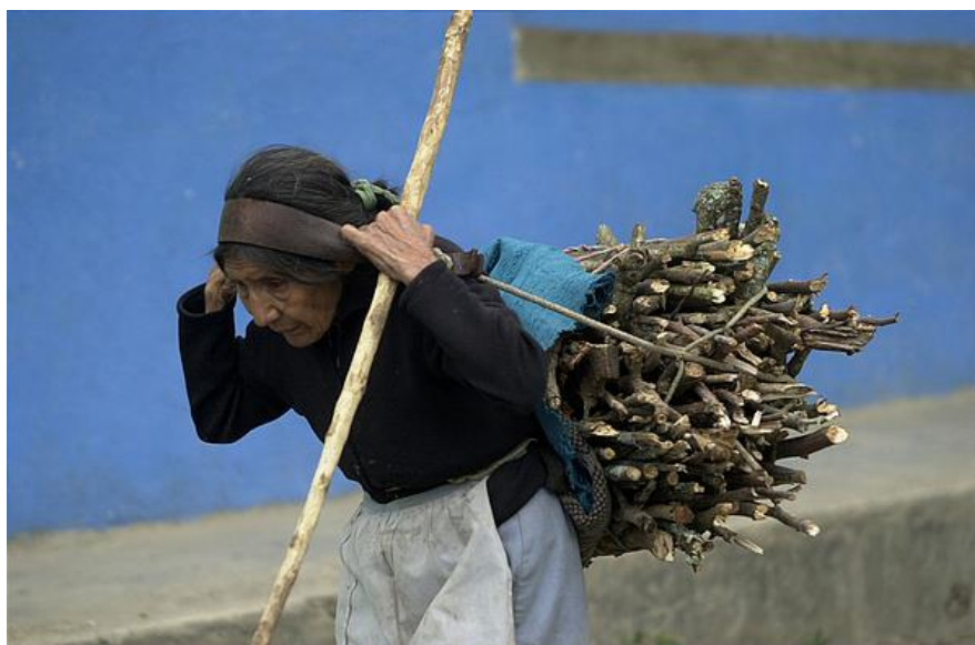
Abbildung 2: heutige Holzträgerin

damit für die Versorgung von Arbeitstieren genutzt wurde. Desweiteren haben die Hauptanbauprodukte Weizen (Europa) und Mais (Mesoamerika) verschiedene seed-to-yield-ratios , sind also unterschiedlich ergiebig. Für Mais gibt Batten Werte zwischen 1 : 30 und 1 : 200 an, während sie für Weizen nur zwischen 1 : 3 und 1 : 6 liegen. Damit ergibt sich, daß in Europa eineinhalb mal mehr Land für die Ernährung von 1000 Personen braucht, als in Mesoamerika (Batten 1999: 3).